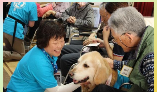
今年初めてのアニマルセラピー